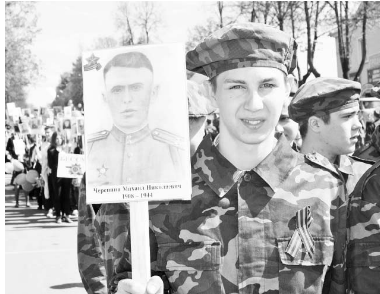
В Бессмертном полку...

Не смог дед Миша приехать на Красную Площадь в 1945-м. А с 2015-го стал участником